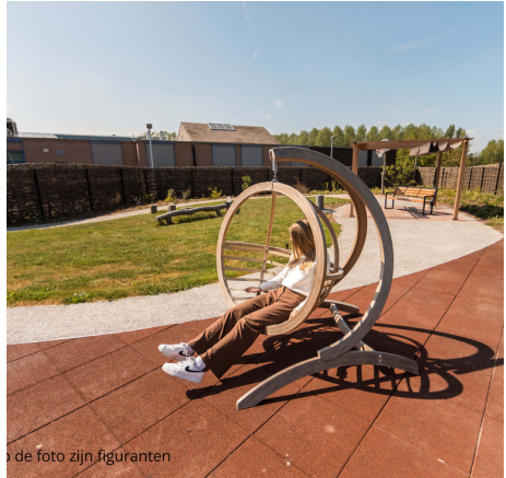
de foto zijn figuranten